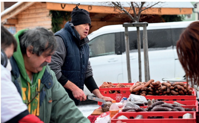
A Volarští nepřišli ani o každoroční zabijačku.