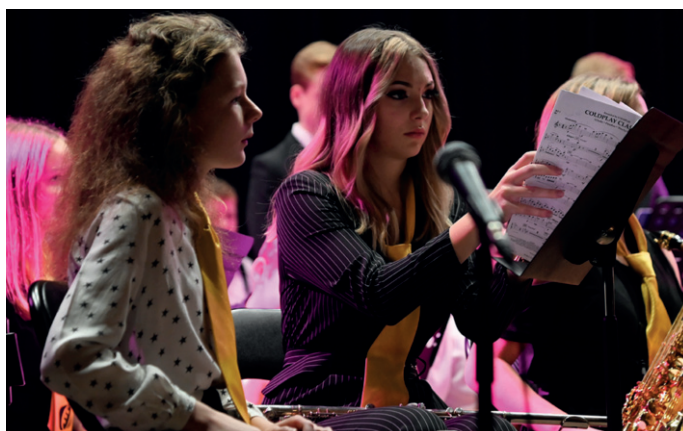
Ozdobou adventu byl tradiční koncert ZUŠ Volary.