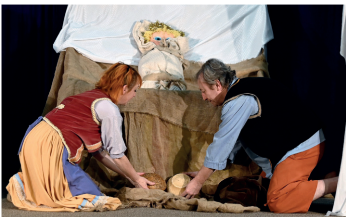
Těšení na Vánoce dětem zpestřilo Vánoční pohádkou Divadýlko Mrak.