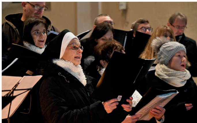
Třetí adventní neděli přijel do Volar zazpívat chrámový sbor z Prachatic.