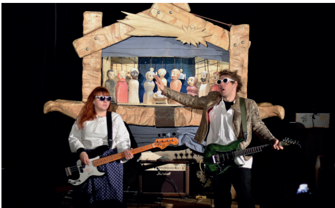
Zcela originální podobu vánočního příběhu předvedli sourozenci Marčíkovi.