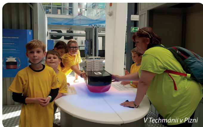
V Techmánii v Plzni