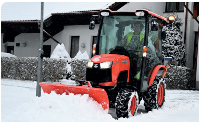
Vánoční výzdobu doplnil sníh. Napadl o první adventní sobotě.