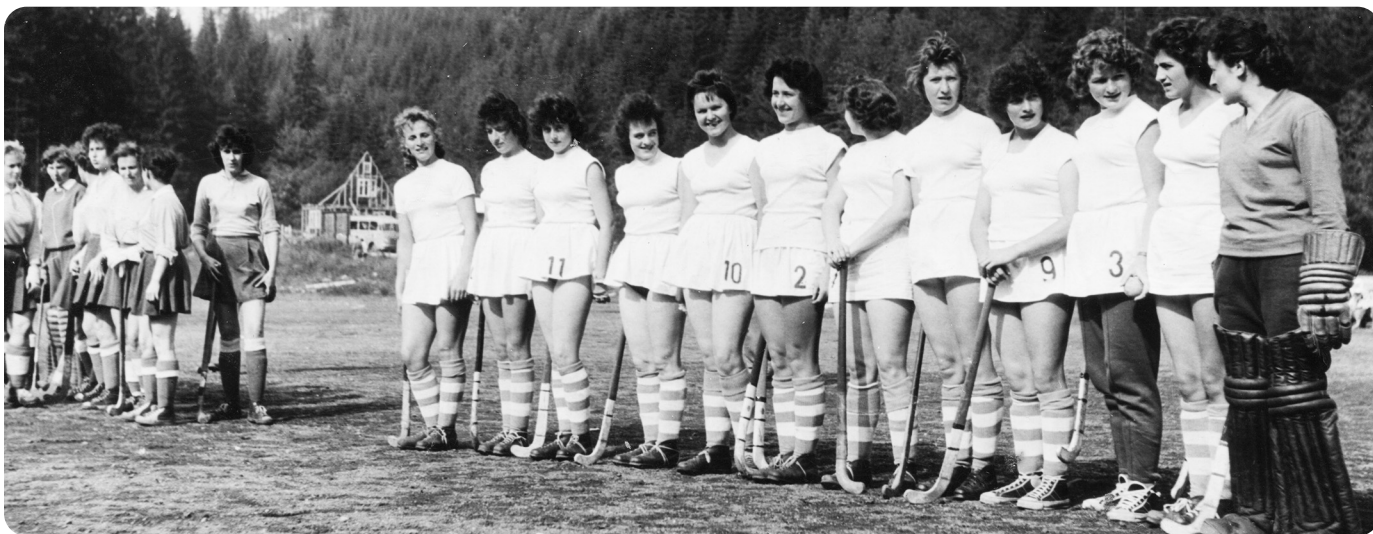
Pozemní hokejistky Rudé Hvězdy Volary na soustředění ve Špindlerově Mlýně před mistrovstvím republiky 1961.