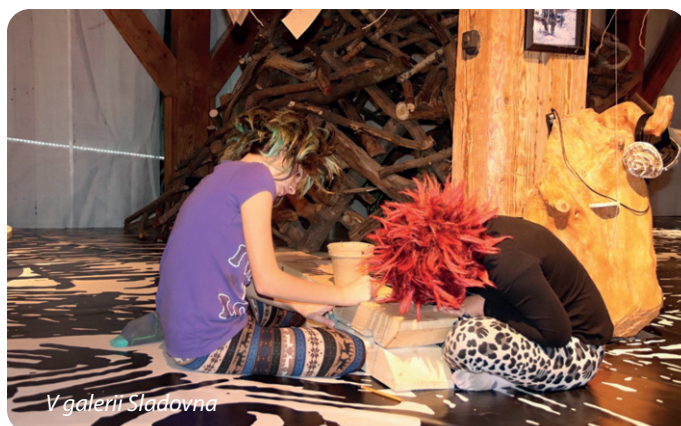
V galerii Sladovna