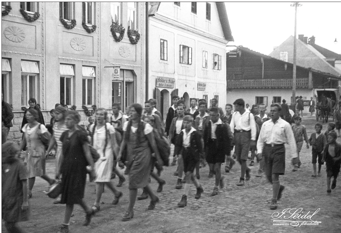
Pohled na křižovatku ulic Tovární, Česká, Soumarská ze směru od náměstí. Dům vlevo stojí, místo prodejny a tabáku se v něm dnes nachází Café Time.