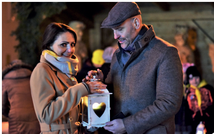
Tečka za adventem patřila skautům, kteří přivezli Betlémské světlo.